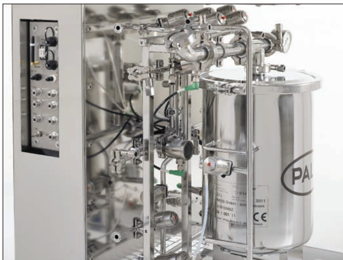
带通信接口的侧视图