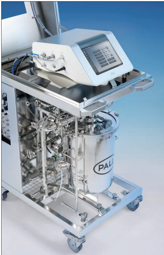
提起盖子显示 Palltronic Flowstar 测试仪内部

作为集成式打印机的替代方案，系统数据也可以导出到外部打印机上打印，外部打印机可以是网络打印机，也可以是通过 USB 连接的打印机。打印数据也能便捷地导出为各种标准格式的电子文件，如 PDF 或 XML。